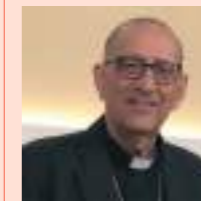
CARDENAL JUAN JOSÉ OMELLA

Todos nosotros formamos el Pueblo de Dios, llamados a caminar juntos y a dejar en este mundo, en nuestro tiempo, la huella imborrable de Jesús, el Señor.